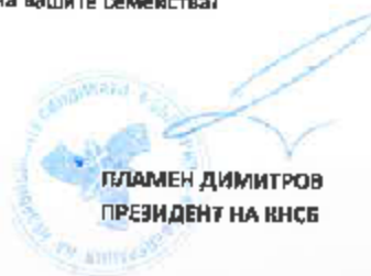
БЛАМЕН ДИМИТРОВ ПРЕЗИДЕНТ НА КНСБ

Желея здраве и успех както на вас, така и на вашите семейства!